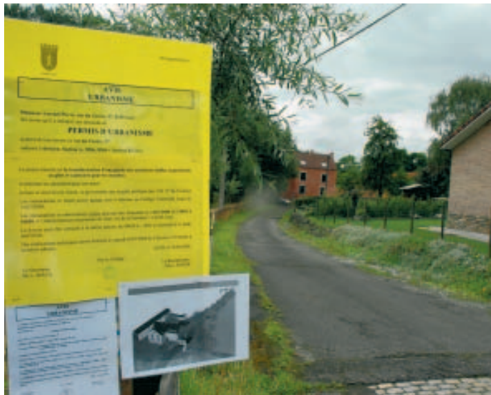
TH.L. Ce site, situé en zone classée, entraînait une enquête publique. ■ TH.L.

Lundi soir, la commune ne pouvait nous fournir les résultats de cette enquête publique. «